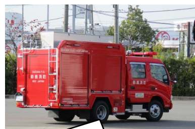
現場へと急ぐ消防自動車