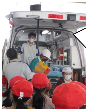
神戸中学校の生徒が職場体験にきていました。