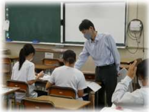
テスト前学習のようす(放課後)

ストの振り返りがしっかりできると思います。今回のテストは計画的に勉強を進めることができたでしょうか。今回、テスト勉強を計画的にできなかったなあ…という人は、次回の期末テストでは早めに計画を立てて、テストに臨んでください。また、1学期の中間テストのときにも書きましたが、「テストは終わった後の振り返りが大切」です。ほっと一息したいところですが、振り返りをしっかりやって過去の自分を超えていってくださいね。