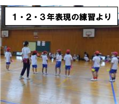
1・2・3年表現の練習より