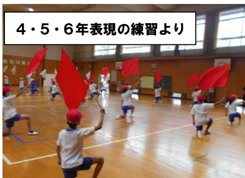
4・5・6年表現の練習より