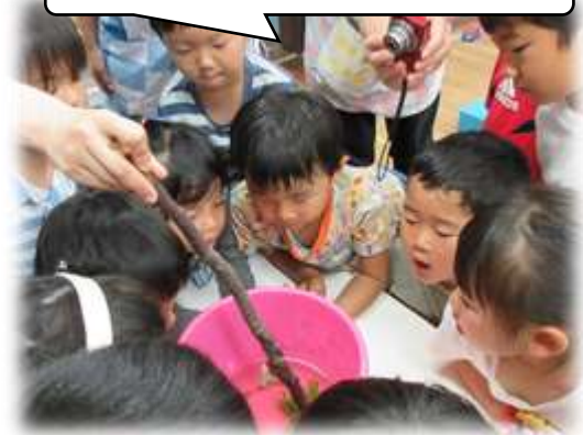
トンボの羽化を見守る子どもたち

人間として生きる力を育みます。また、地域に出かけたり、地域の方の力をお借りしたりして、子どもが地域の自然や地域の方々とふれあう活動を保育に取り入れています。