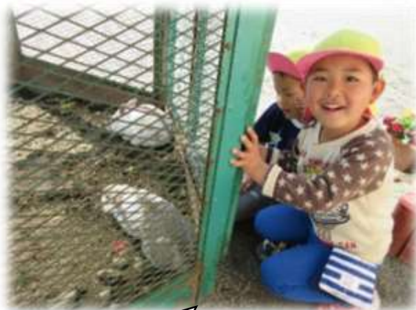
うさぎのふわふわちゃんと くっきーちゃん

毎年、神戸幼稚園のろうかには、飼育ケースがずらりと並びます。草花摘みや虫とりをしたり、小動物を飼育したり、花や野菜を育てたりすることを通して、自然への興味・関心を育てます。また、自然との触れ合いを通して、驚き、疑問、喜び、愛情等豊かな心を育てるとともに、働くことや収穫の喜び等いろいろな体験をする中で、