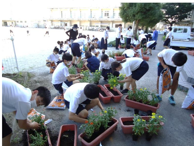
花の植え替え (6月28日)