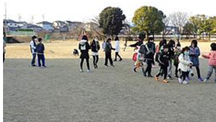
左：あいさつスタンプの呼びかけポスター