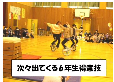
次々出てくる6年生得意技