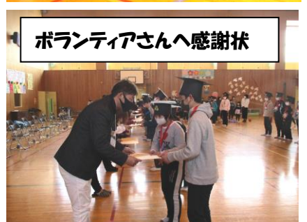
ボランティアさんへ感謝状