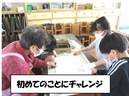
初めてのことにチャレンジ

2月25日(金)2年生で初めて、版画印刷に挑戦しました。久しぶりに学習支援ボランティアさんにも入っていただきました。子どもたちは自分たちの顔を紙で切り貼りをした原画にインクをつけて印刷するのですが、出来上がりにドキドキ。インクの載せ方やバレンでのこすり方など、初めての体験でしたが、ボランティアさんのサポートをお借りして、一人3枚ずつ印刷する間に、しっかりコツを覚えました。