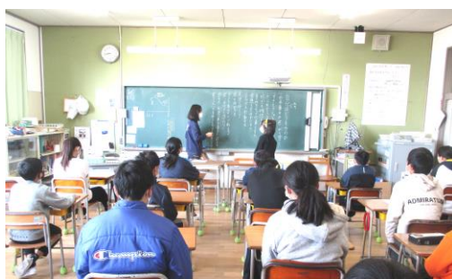
自分たちがすべきことは何だろう…

9日後に、6年間にわたって椿小学校で学んできた集大成として、最後の授業「卒業式」が行われます。「どんなふうに卒業式をむかえたいか」を、自分たちで考え、行動し、形作ることを担任は子どもたちに課しています。学習面、生活面、卒業式の練習と仕上げ、自分たちの力で、よりよいものにしていきたいという気持ちを確認し、そのためには何が必要で、何をしなくてはならないか、残された時間はあとわずかです。