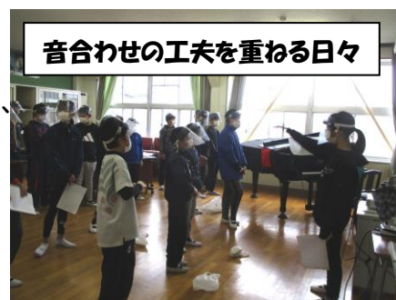
音合わせの工夫を重ねる日々

まん延防止期間が長引き、十分に歌の練習ができていない中で、自主練習が始まりました。リズムの取れないところなどは、工夫しながら自分たちで進めます。椿小学校の目標である「自ら学び、力を合わせてやり抜く子どもの育成」。より良い方向へと真剣に考える6年生をみて、胸が熱くなり、子どもたちの成長をかみしめる数日となりそうです。