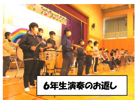
6年生演奏のお返し