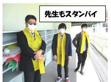
先生もスタンバイ