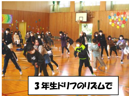
3年生ドリフのリズムで