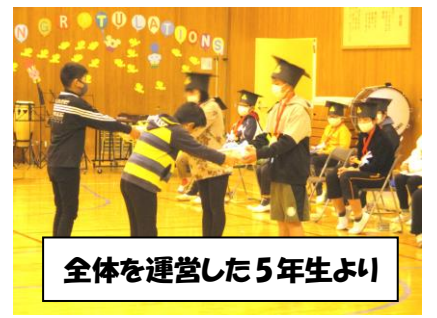
全体を運営した5年生より