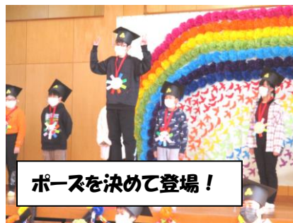
ポーズを決めて登場!