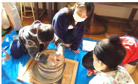
石臼できなこをひいてみたよ

3年生は昔の暮らしについて調べました。2/8には環境学習センターの出前授業で昔の暮らしはどんなものであったか、昔と今の暮らしではどこがどう違うかを学習しました。子どもたちは電気やガスのない昔の生活の説明を聞いたり実際に動かしてみたりしました。今の生活の便利さを実感できました。