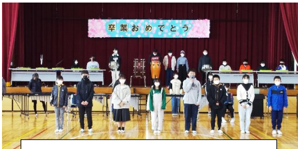
6年生からメッセージと合奏披露