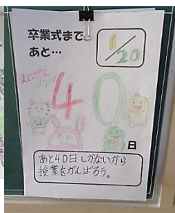
6-2学級目標「まめちしき」