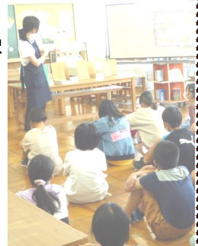
図書支援員による読書指導