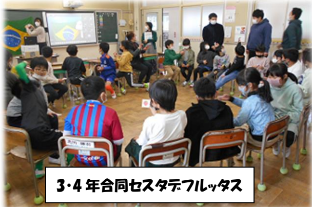
3・4年合同セスタデフルッタス

「ブラジルにまつわるクイズ」では、「ブラジルの学校には給食があるか」「自分たちで掃除をしているか」などのクイズに答え、ブラジルと日本の学校の違いに驚きました。