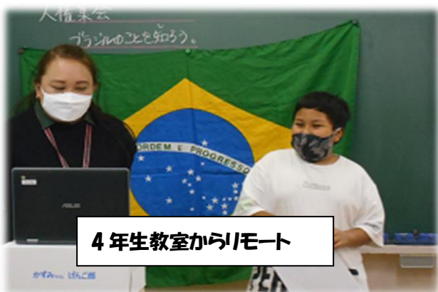
4年生教室からリモート