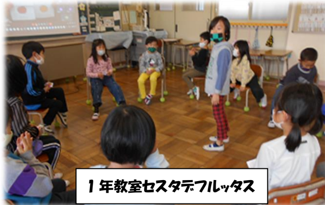
1年教室セスタデフルッタス

6年生が調べたポルトガル語の紹介のあと、「ポルトガル語でフルーツバスケット」を各教室で行いました。3年生と4年生は、4年生の教室にて合同で行い楽しみました。