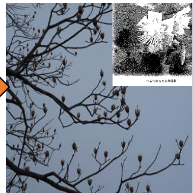
平成5年移植時