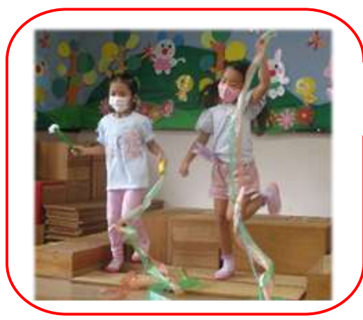
僕もコンサートをするよ！！