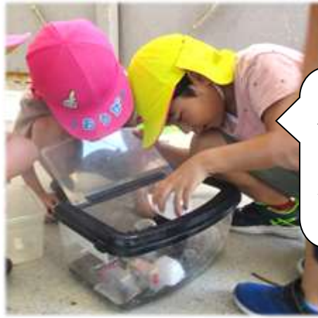
コオロギの家 作ったよ。ここ は食堂！ごは ん食べるところ〜♪