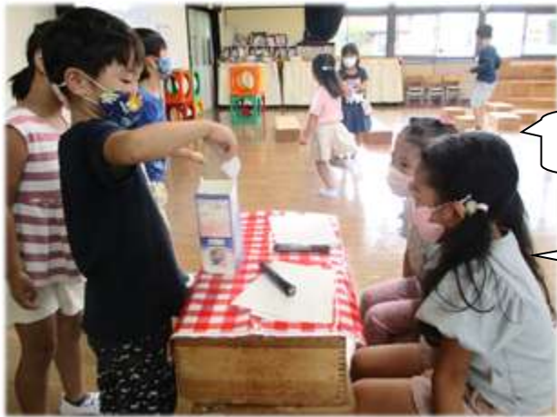
コンサートをします♡