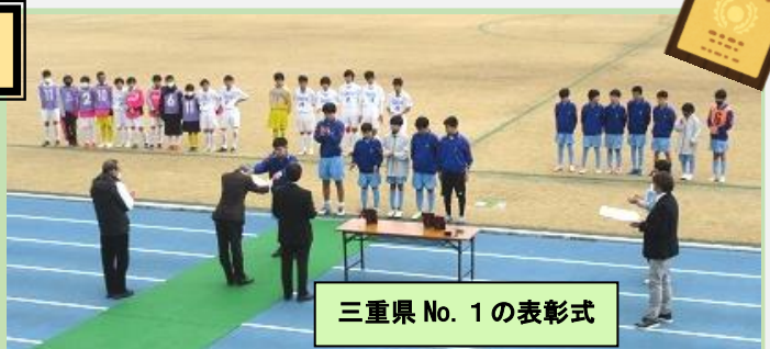
三重県 No. 1 の表彰式

12月19日(日)に行われた「AGF カップ新人県大会」で鈴峰中学校が矢渕中を5対2で下し、見事に優勝しました！