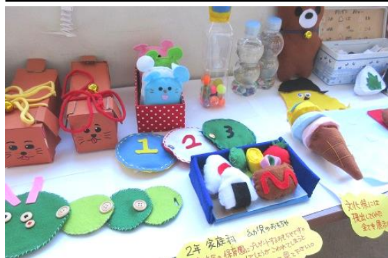
文化祭でも展示した「手作りのおもちゃ」

2年生が家庭科の授業の一環として制作したオリジナルおもちゃを、例年職場体験学習で実習先としてお世話になっている、岸田保育園、庄内青い鳥保育園、ながさわ保育園、深伊沢保育所の4園にプレゼントしました。ご近所のながさわ保育園では12月14日に年長園児さんが代表となって鈴峰中に来てくれ、こちらも2年生代表のC組（時間割の都合です）と「ミニ贈呈式」で交流しました。和気あいあいの温かい時間を過ごしました。