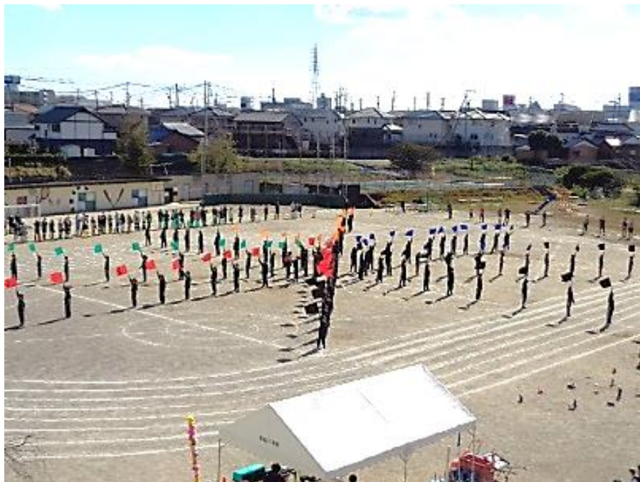
5, 6年生 フラッグによる 表現演技

P T A本部，体育部並びにボランティアの皆様，事前の除草作業から当日の片付けまで大変お世話になりました。今後とも本校の教育活動にご支援・ご協力をお願いいたします。