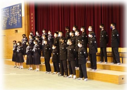
心を一つに思いを込めて歌いました