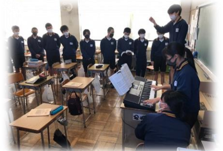
クラスで目標を立て、取り組みました

本年度生徒会スローガン『深めよう絆 咲かせよう笑顔』のもと、1ヶ月前からクラスで一致団結して練習に取り組みました。当日は、聴いている人の心に響く最高の歌声を奏でました。どの学年・クラスも歌い終わった後は、全力を出し切ったすがすがしい笑顔が見られました。これからの学校生活にもつながる合唱コンクールになりました。恒例の美術部、パソコン部、7・8組、理科等の展示では、それぞれの特徴を活かした力作ばかりでした。また、文化祭の最後を飾った吹奏楽部の演奏は、全身に響き渡るような音色で、明日からの活力・元気をもらえる素晴らしいものでした。