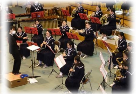
3年間の総決算 吹奏楽部演奏