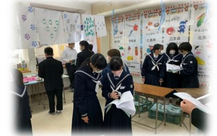
文化部展示を見学する様子