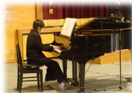
伴奏は任せてください!