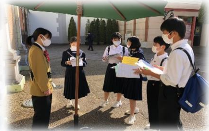
1年 班で協力してのワインづくり ・足湯で疲れを癒し、くつろぎました 2年 仕事のやりがいをキャストにインタビュー