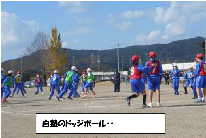
白熱のドッジボール・・・

5・6年生は、自分たちで考えた種目に挑戦しました。一つ目は「しょうがい物リレー」です。いろいろな物を用意して楽しくリレーを行いました。