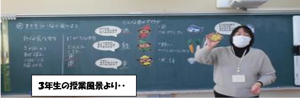
3年生の授業風景より・・・