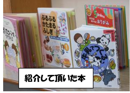
紹介して頂いた本

11月26日(金)1・2年生,5・6年生がミニ団体競技会をしている時に,3年生は◎限目に「すききらいなく食べよう」,4年生は◎限目に「元気な体を作ろう」の食育学習を行いました。食べた物で体が作られることを実感し,これからも「すききらいなく食べて,元気な体を作ってほしい」と思います。3年生は◎限目に食べ物の booktalk をしてもらいました。