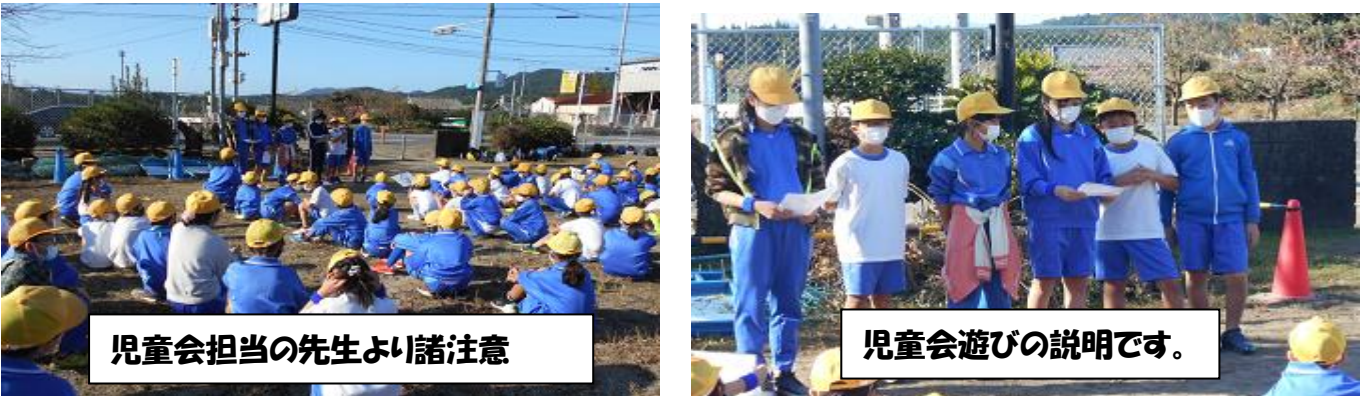
児童会担当の先生より諸注意