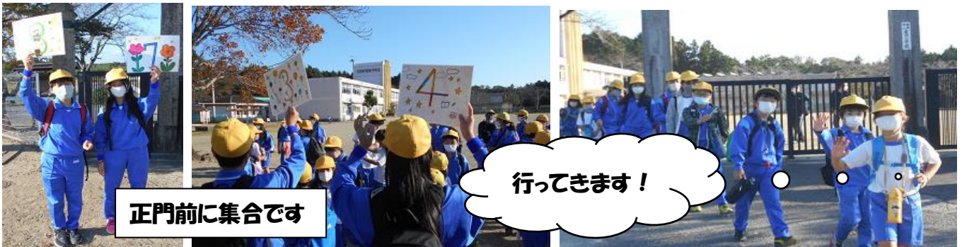
正門前に集合です