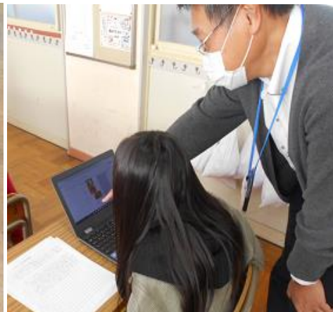
【装飾の仕方を習いました】

【6年生】は総合的な学習の時間に調べたことを新聞にしました。①限目は文字入力を中心に、そして②限目は画像の取り込みや文字装飾などに取り組みました。