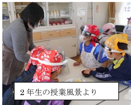
2年生の授業風景より