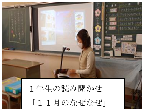
1年生の読み聞かせ 「11月のなぜなぜ」