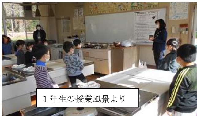
1年生の授業風景より