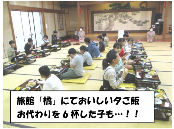
旅館「橋」にておいしい夕ご飯 お代わりを6杯した子も…！！