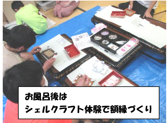
お風呂後は シェルクラフト体験で顔縁づくり