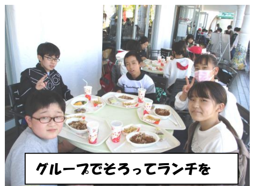
グループでそろってランチを

最高学年として、これまでもリーダーとして頑張ってくれている6年生ですが、卒業までの後半戦も楽しみです。