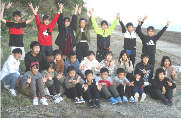
国崎漁港の鐘崎灯台の下で夕方の海に黄昏る。