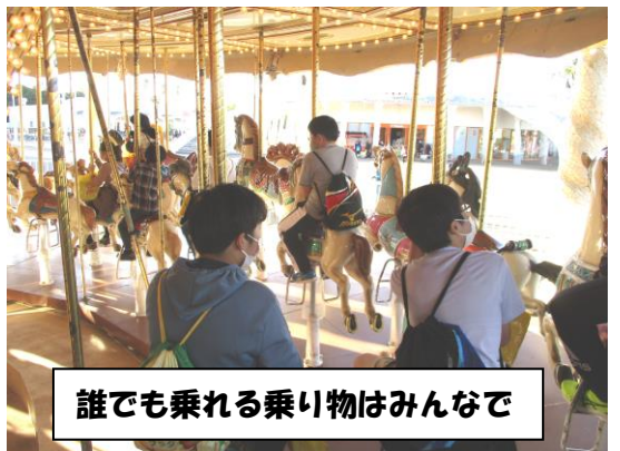
誰でも乗れる乗り物はみんな

2日目は、朝のラジオ体操、朝風呂からの、賢島クルーズ、志摩スペイン村と満喫しました。