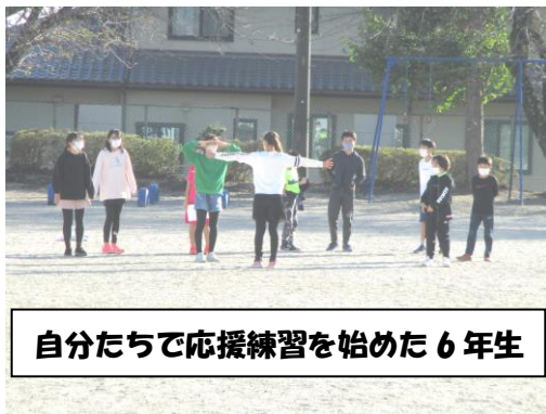
自分たちで応援練習を始めた6年生

1学期から「ダンス教室」で身体を動かすことを楽しく学んだ子どもたちは、低学年、高学年に分かれてダンスの合同練習を始めました。10月25日の委員会では、役割分担や打ち合わせをおこないました。バトン渡しの練習は