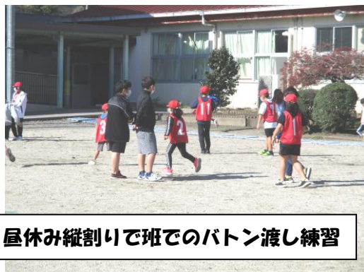
昼休み縦割りで班でのバトン渡し練習

縦割り班で業間や昼休みに高学年のリードでおこなっています。また、6年生は自発的に応援合戦の練習を運動場で行う姿も見られ、成長を感じさせてくれ嬉しく思います。