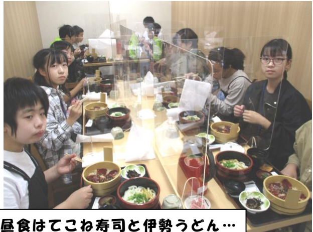
昼食はてこね寿司と伊勢うどん… 初めての味にドキドキ♥

10月28日(木)29日(金)の2日間にわたって、6年生が伊勢志摩方面に修学旅行に行きました。コロナ感染症のために、行く先は従来の京都・奈良方面ではありませんでしたが、晴天に恵まれ、全員参加もでき、無事に過ごせたことを本当にありがたく思います。