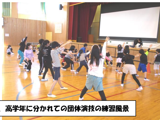
低学年、高学年に分かれての団体演技の練習風景