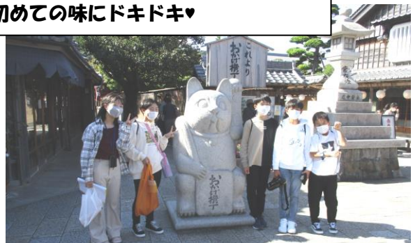
おかげ横丁でお土産をみつけろって… はじめての家族へのお土産かも…