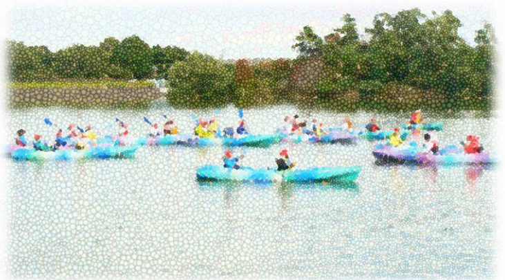
準備体操の後、パドル（水をこぐ道具）の使い方を教えていただき、こぎ方のイメージトレーニングを行いました