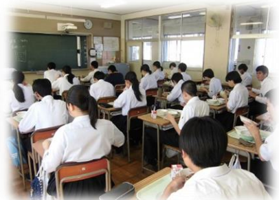
前を向いての黙食での昼食