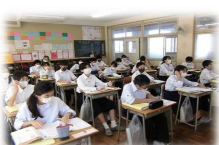
全員揃っての教室での対面授業