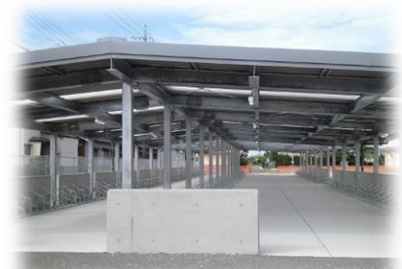
完成した自転車置場

9月30日に第6回大木中学校建設委員会が開催されました。自転車置場が完成し，いよいよ10月1日から校舎の本格的な建設工事が始まります。会議では，建設に至るまでの経緯，これからの工事概要などの説明がありました。また，建設委員会から新校舎のイメージパネルをいただきました。正面玄関，生徒昇降口に掲示します。