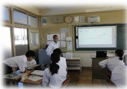
仲間にICT機器を使ってる発表