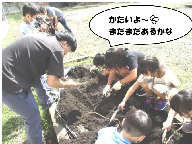
かたいよ～お まだまだあるかな

春に植えたさつまいもでしたが、葉をシカに食べられて、先週の数日の間にまったくなくなってしまいました。しかし、心配されたお芋は、なんとか残っていました。