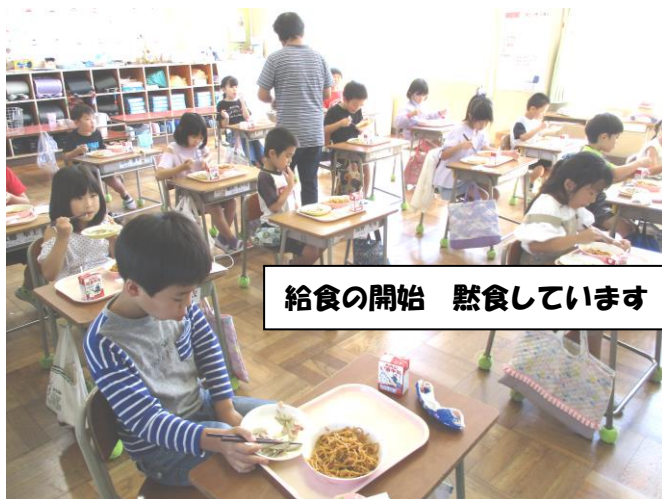
給食の開始 黙食しています

特に低学年のうちには、お子さんの学習習慣が身につくようになるまでに、お家の方の助けが本当に大切であることをつくづく思います。小学校のうちの子どもの宿題は、どうしてもお家の方にも時間をとっていただかなくてはなりません。宿題のでき具合をみる。音読を聞く。時間割や持ち物を一緒に合わせてあげる。手をかけ、目をかけ、励ましの言葉を根気強くかけてやっていただくうちに、やがて習慣化し、高学年にかけて手を放していい時期が来ます。目はまだしばらくは離せませんが…。なかなか「やった?」「できた?」だけでできるものではありません。一緒にやっていただけると子どものやる気もぐんぐんあがるように思います。