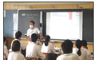
先週の午前中登校も滞りなく実施できました。