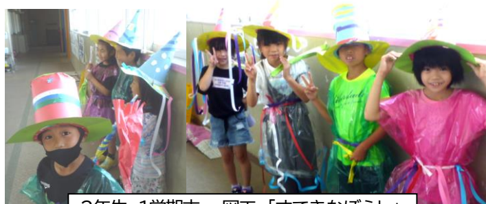
2年生 1学期末 図工「すてきなぼうし」

午後から利用する児童は、各学年の昇降口からではなく、正面玄関から入って図書室に入ってください。 本の貸し出しや返却はもちろん、宿題もできます。(親子でお越しいただいても結構です。)