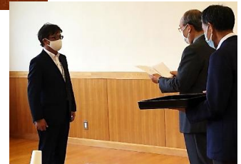
もくろくぞうてい 目録贈呈