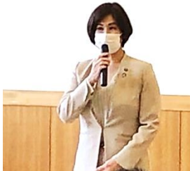
すえまつしちょう 末松市長