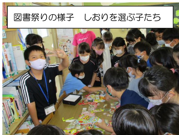
図書祭りの様子 しおりを選ぶ子たち

また、今週は図書委員会主催の「図書祭り」がありました。業間や昼休みに図書館に集まって、クイズや児童による読み聞かせに参加すると、参加賞（手作りしおり）がもらえます。この日は、たくさんの参加者で図書室がいっぱいになってしまいました。図書委員さんいろいろアイデアと活動ありがとう。図書室にきたついでに、たくさんの方が本を借りてくれると嬉しいですね。