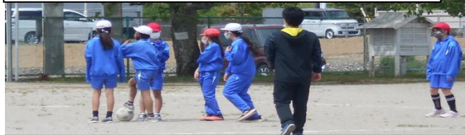
庄内の子は外遊びが大好き・・・休み時間の一コマより