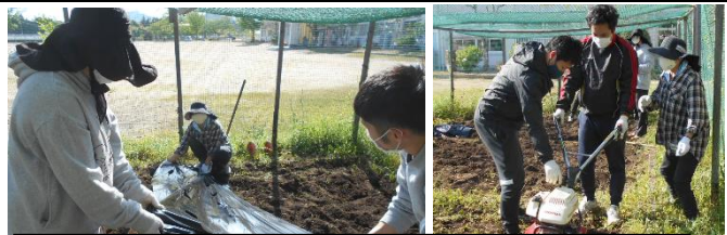
4/26 みんなが下校した後、先生たちで学級園の準備。