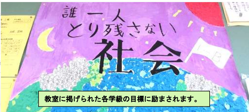
教室に掲げられた各学級の目標に励まされます。