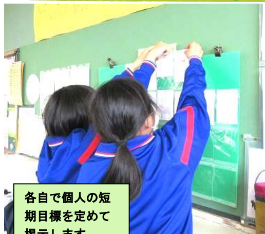
各自で個人の短期目標を定めて掲示します。

「何かを達成するために」「力をつけるために」「心豊かな生活をするために」と、目標をもって生活することは、とても大切です。鈴峰中学校では、2週間ごとに各自が短期目標を定め、期間の終わりに振り返りをし、また新たな目標を定めて取組を進め、お互いに評価しあう活動を継続して行っています。このことによって、日々の学校生活の充実感が増すことや、生徒同士がお互いに高めあってゆくこともねらいです。「学校がたのしい」と感じる人の割合が高まるよう、活動を進めていきたいですね。