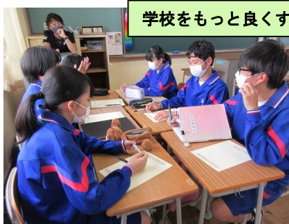
学校をもっと良くするには・・・