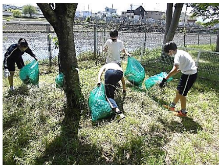
5/6 子ども達、頑張ります

また、子ども達も草の刈り払い作業の様子を知っており、5月6日の掃除時間に、5、6年生がグラウンド周辺に集積された草を集める作業に加わってくれました。保護者の方々の大変さを感じる機会にもなったと思います。5、6年生の皆さん、ありがとうございました。