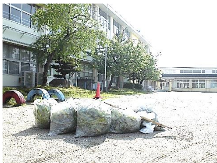
5/8 晴天、保護者の方が作業、回収 作業の様子などは学校HPにも掲載しています