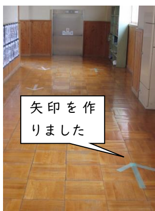
矢印を作りました