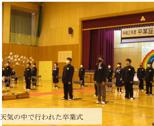
令和2年度 卒業証書

3月19日、椿小学校の卒業式を無事、執り行うことができました。私の経験の中では、桜の花が咲き始めた中での初めての卒業式となりました。本来ならたくさんのご来賓の方々にも見ていただきたかったのですがそれはかないませんでした。しかし、卒業生15名は、春本番のような陽気の中、晴れやかに巣立っていきました。