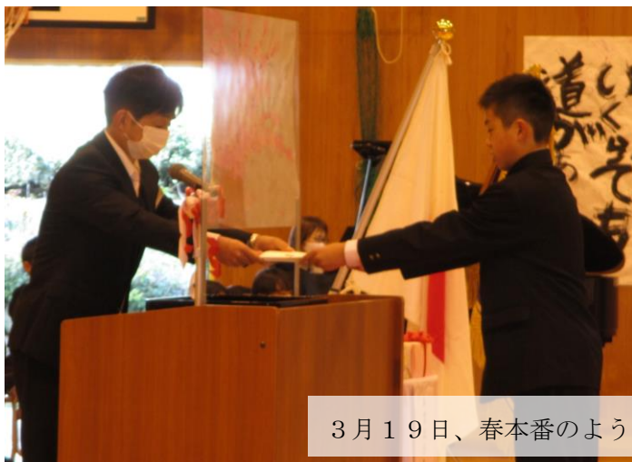
3月19日、春本番のような天気の中で行われた卒業式