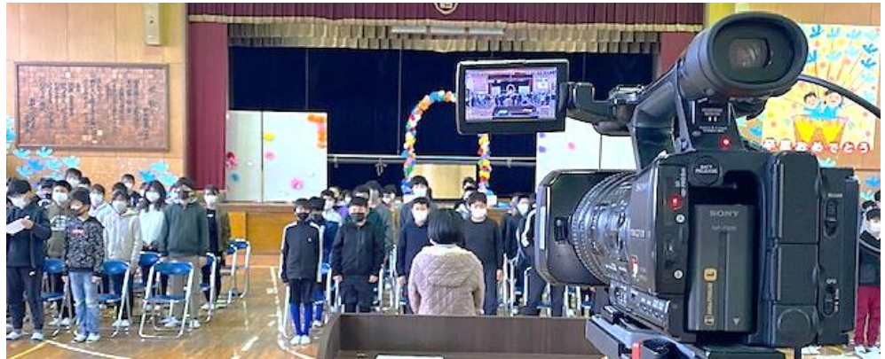
そつぎょうしき れんしゅう ようす おんせいしゅうろくぼめん 卒業式の練習の様子 (DVDへの音声収録場面)