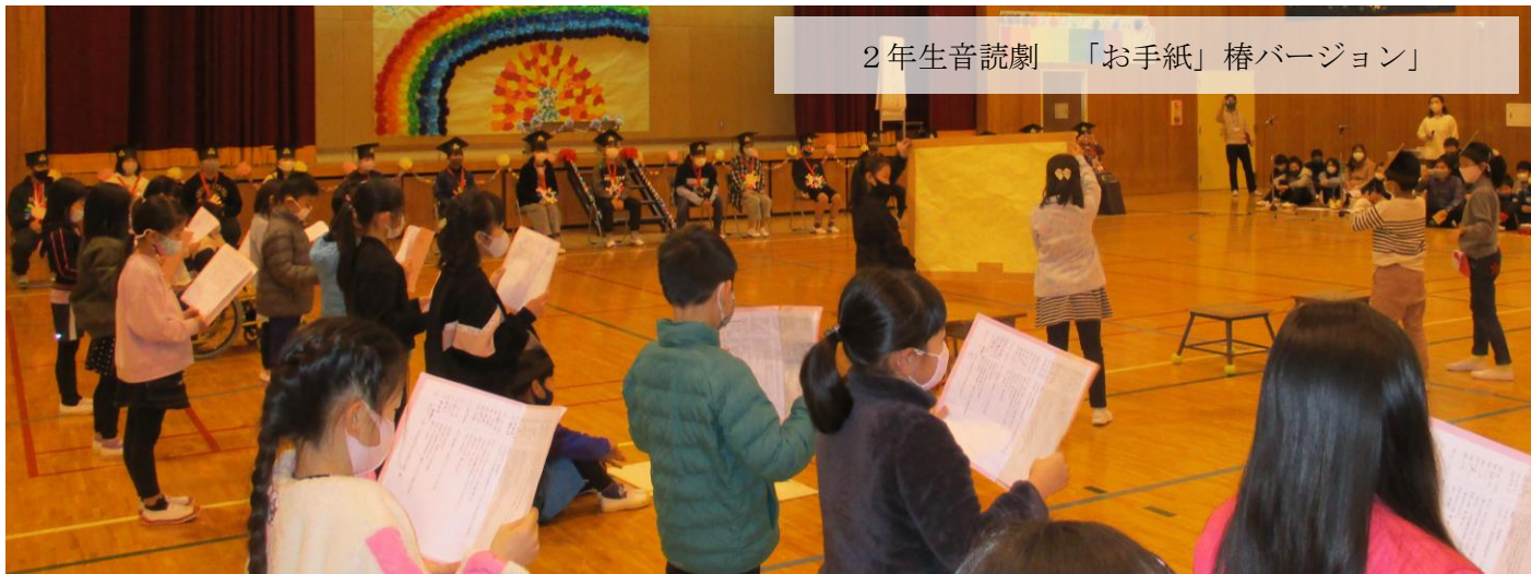
2年生音読劇 「お手紙」椿バージョン