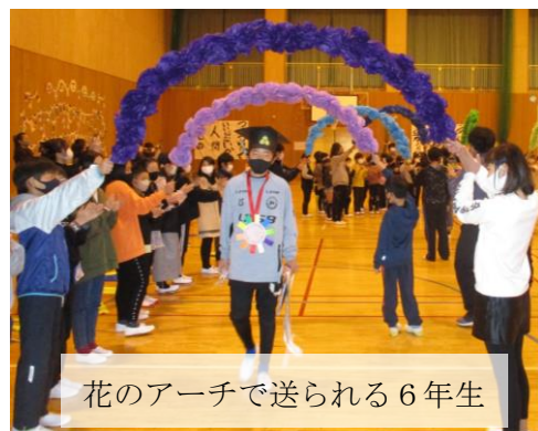
花のアーチで送られる6年生

椿小学校は、卒業式の時に、恒例で、全学年から選ばれた代表が、6年生一人ひとりに、「心の花束」として感謝の気持ちを言葉で伝えます。しかし、今年の卒業式は、この椿小ならではの感動的な演出が、4、5年生しか参加できないため行えません。そこで、この「送る会」の場で、「心の花束」を6年生に贈りました。5年生は、出し物はありませんでしたが、会の準備や運営で十分に力を発揮してくれました。今年初めて試みたキャンドルサービスの場では、6年生から、全校児童へ椿小学校として引き継いでほしいことが伝えられました。