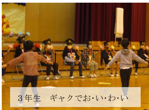
3年生 ギャクでお・い・わ・い