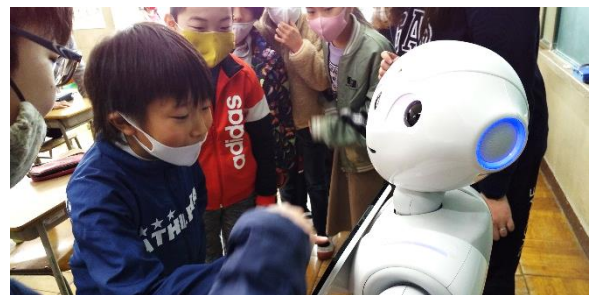
ペッパー君の都道府県クイズは難しいね。