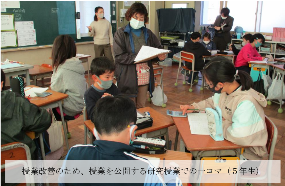
授業改善のため、授業を公開する研究授業での一コマ（5年生）

先日、「大学入学共通テスト」が実施されました。昨年までの「大学入試センター試験」に変わるものです。単に名前が変わっただけではなく、センター試験と比べ、思考力や判断力を重視する問題が増えていると言われています。このような、大学入試の改革は、子どもたちに、来るべき“新しい時代”に対応する力を