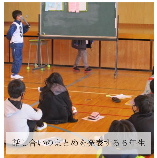
話し合いのまとめを発表する6年生

「こちらから声をかけていく。」とか、「相手が嫌と思うことを言わない。」など、子どもたちの素直な意見が、学年に関係なく出ていました。そして、6年生が、話し合いが活発に進むように、気を配っている姿がとても良かったです。縦割り班遊びもいいいけれど、いろいろなことを考えていく場としても異学年の集団というのは、いいものだと感じました。