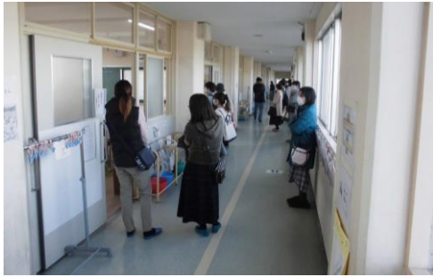
2学期授業公開デーの様子

3学期の公開デーを1月27日2限3限に予定しています。今年度は感染症対策でご不自由をおかけすることが多々ありますが、今後ともご理解、ご協力をお願いします。詳細については学校配布のプリント等をご覧ください。