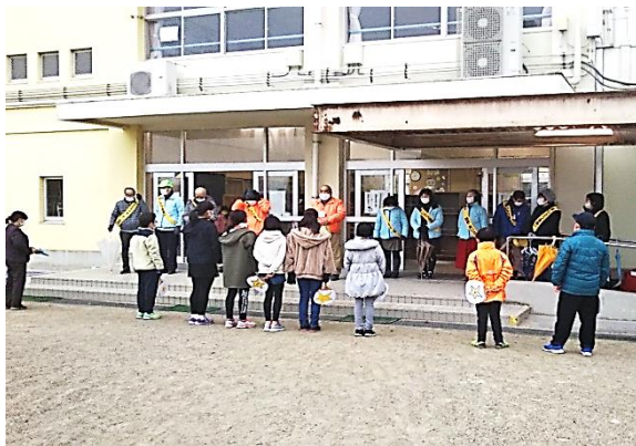
1/12, 児童会と地域の方であいさつ運動

そして家庭との連携事業として「学習ぐんぐんアップ活動」を1, 2学期おこないました。ご協力ありがとうございました。引き続き3学期も実施します。