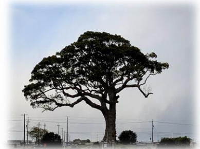
県指定文化財 長太の大楠

2021年（令和3年）が幕を開けました。年末年始は、新しい生活様式でお過ごしだったのではないのでしょうか。新型コロナウイルス感染症がまだまだ収束に向かわない中で3学期の開始となりましたが、今まで以上の感染症対策をとりながら、1年間の学習のまとめとしての教育活動をしつかりと進めていきたいと思えます。引き続き、ご理解ご協力よろしくお願ひいたします。