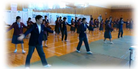
学年全体で生き生きと踊ったダンス

「支え合い、高め合い、未来に向かって学び続ける生徒の育成」～「聴き合う関係」を大切にした対話的で深い学びの創造とキャリア教育の充実を通して～の研究主題で研究発表会を実施しました。3年生のダンス発表に始まり、国語、社会、数学、理科、美術、保健体育、英語の7教科の授業発表をした後、各分科会を実施し活発に意見交換が行われました。鈴鹿市教育長