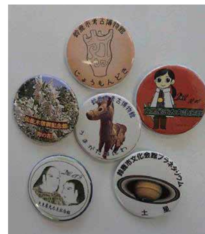
オリジナル缶バッジ(一部)