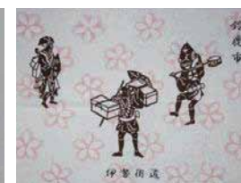
④ オリジナル手ぬぐい