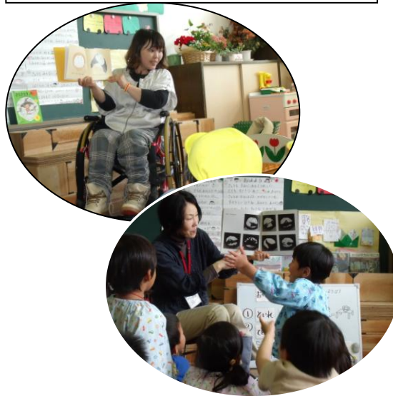
週1度のおはなしやさんの読み聞かせ

入園料はいりません。 保育料 6,200円 給食代 4,000円 その他の諸経費 合わせて 11,000円 程度です。